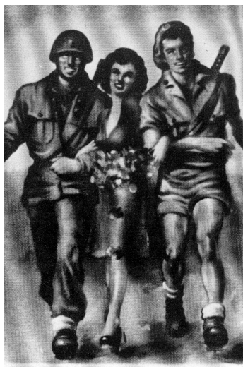
1 Ausiliaria. FPM. 1944. Non firmata.